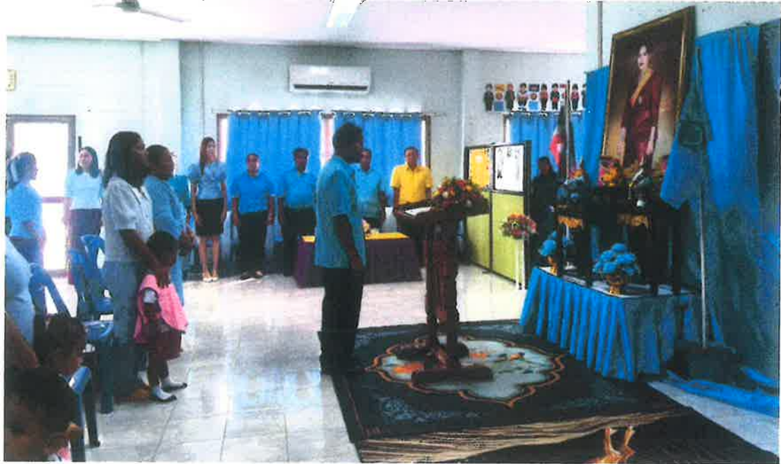
รูปกิจกรรมวันแม่แห่งชาติ ประจำปีการศึกษา ๒๕๖๘