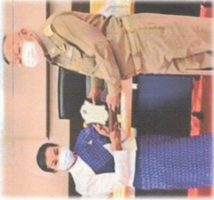
คำขวัญบ้านโคกบุญสอนของ

40 ม.11 ต.โพธิ์ตาก อ.โพธิ์ตาก จ.หนองคาย 098-349-0815 หรือ 098-229-9750