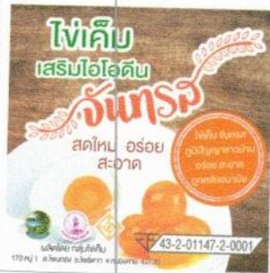
โปรดใส่ภาพประกอบ